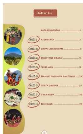
Gambar 4 Tampilan Halaman Daftar Isi

Halaman daftar isi bertujuan agar memudahkan pembaca mencari letak halaman sesuai topik yang ingin dibaca dengan melihat nomor halaman yang terletak di tengah bawah. Daftar isi juga memuat beberapa gambar atau ilustrasi yang merupakan representasi dari materi dengan tujuan untuk memunculkan rasa ketertarikan untuk membaca. Gambar 4 merupakan halaman daftar isi dalam buku digital membaca BIPA tingkat menengah wawasan Budaya Banyumas.