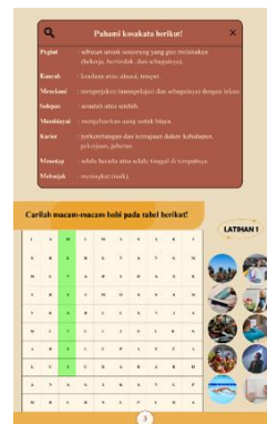
Gambar 6 Tampilan Halaman Kosakata dan Latihan Soal Unit 1