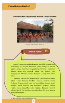
Gambar 7 Tampilan Halaman Materi Budaya Banyumas Unit 1