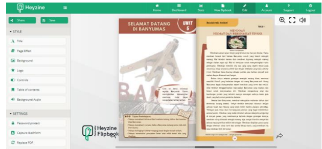
Gambar 10 Tampilan Buku Digital dalam Heyzine Flipbook