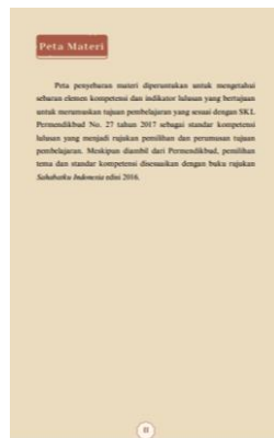
Gambar 3 Tampilan Halaman Peta Materi

Halaman peta materi berisi informasi tentang perumusan materi dalam buku digital yang berpedoman pada Standar Kelulusan CEFR dan merujuk pada pemetaan materi buku Sahabatku Indonesia dengan modifikasi sesuai dengan karakteristik dan analisis kebutuhan.