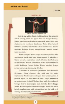
Gambar 8 Tampilan Halaman Materi Teks Bacaan Unit 1