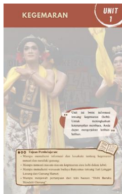
Gambar 5 Tampilan Halaman Sampul Unit 1

singkat dan tujuan pembelajaran serta ilustrasi sesuai dengan materi yang dimuat dalam unit tersebut. Materi setiap unit memuat teks bacaan, kosakata, latihan soal, dan informasi berbasis multimodal tentang wawasan Budaya Banyumas. Gambar 5, 6, 7, dan 8 merupakan halaman isi atau materi dalam bahan ajar digital keterampilan membaca BIPA berbasis multimodal tingkat menengah.