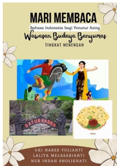
Gambar 1 Tampilan Halaman Sampul

Sampul buku digital didesain menggunakan template yang telah tersedia dalam Canva dengan beberapa modifikasi. Desain sampul menggunakan perpaduan warna cerah dan gelap yaitu hijau lumut, coklat, dan krem. Sampul buku digital didesain dengan perpaduan warna cerah dan gelap agar meningkatkan rasa ketertarikan pemelajar untuk membaca. Isi sampul buku digital terdiri atas judul buku dan tingkat pemelajar. Pemilihan gambar dalam sampul merupakan representasi dari berbagai kegiatan yang dimuat dalam materi buku digital. Gambar 6 merupakan halaman sampul dalam buku digital membaca BIPA tingkat menengah wawasan Budaya Banyumas.