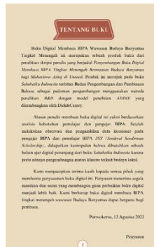
Gambar 2 Tampilan Halaman Tentang Buku