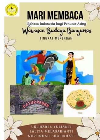
Gambar 12 Halaman Sampul sesudah Revisi

Halaman sampul mendapat revisi berupa perubahan desain. Desain ilustrasi budaya Banyumas awalnya dalam bentuk crop tanpa bingkai. Adanya perubahan desain sampul bertujuan agar ilustrasi dapat terlihat lebih jelas sehingga akan mudah dipahami pembaca. Ditambahkan pula logo intansi sebagai informasi identitas buku.